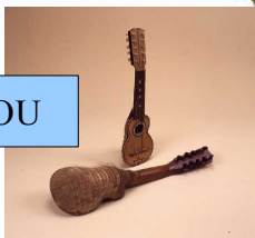
le charango instrument à cordes fait avec une carapace de tatou