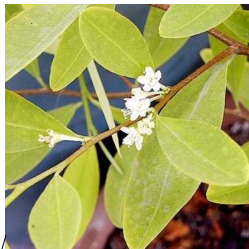
La Hoja-feuille d'arbre vibrant entre les lèvres- instrument à vent