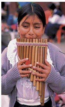
Rondador-Flûte du pan: instrument à vent