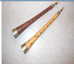
Dulzainas: flûte à 2 bocs instrument à vent