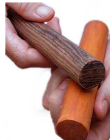
Claves: instrument à percussions